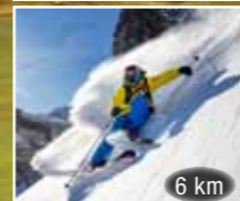
6 km Lyže