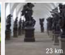
23 km Hospital Kuks