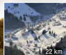
22 km Pec pod Sněžkou