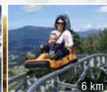
6 km Mladé Buky lyže, bobovka, golf