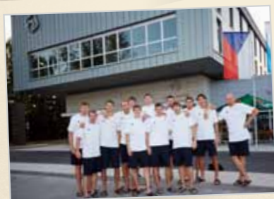
Soustředění českého národního mužstva mužů v basketbalu, Trutnov, Hotel Davídek ****