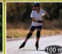
100 m Inline