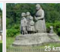
25 km Ratibořice, Babiččino údolí