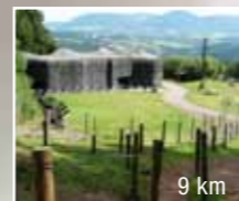
9 km Stachelberg, dělostřelecká tvrz