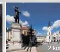
2 km Historické centrum Trutnova (bitva 1866)